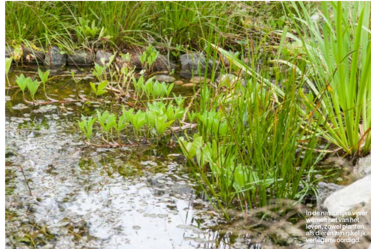
In de natuurlijke vijver wemelt het van het leven, zowel planten als dieren zijn rijkelijk vertegenwoordigd.

Elma studeerde in 2013 af als tuin- en landschapsontwerper en startte haar eigen bureau EKK Colourful Landscaping. In 2015 ging ze opnieuw naar school om ook de technische kant van de opleiding te doen. De ambitie om tuinen te ontwerpen, is ontstaan vanuit haar hobby, die 28 jaar geleden begon. Samen met Rinus streek ze neer in Waskemeer en daarbij kreeg ze ruim 30 x 70 meter tuin tot haar beschikking. De vorige eigenaar die als hobby vogels in volières hield, had het erf met hekjes en hokjes in compartimenten verdeeld. Elma, toen nog groen achter de oren maar niet in de vingers, is gewoon ergens begonnen. Langs de sloot spitte ze een deel van de tuin om en de bomen die er al stonden, vulde ze aan met struiken. „Van huis uit was ik wel een tuin gewend, maar ik had geen kennis van tuinieren. Pas toen ik medio jaren 90 tuinbladen ging lezen, begon het bij mij echt te leven.” De regenboogborder was de eerste stap naar de nieuwe tuin. Een enorm brede conifeer in het midden van de tuin werd gekapt en