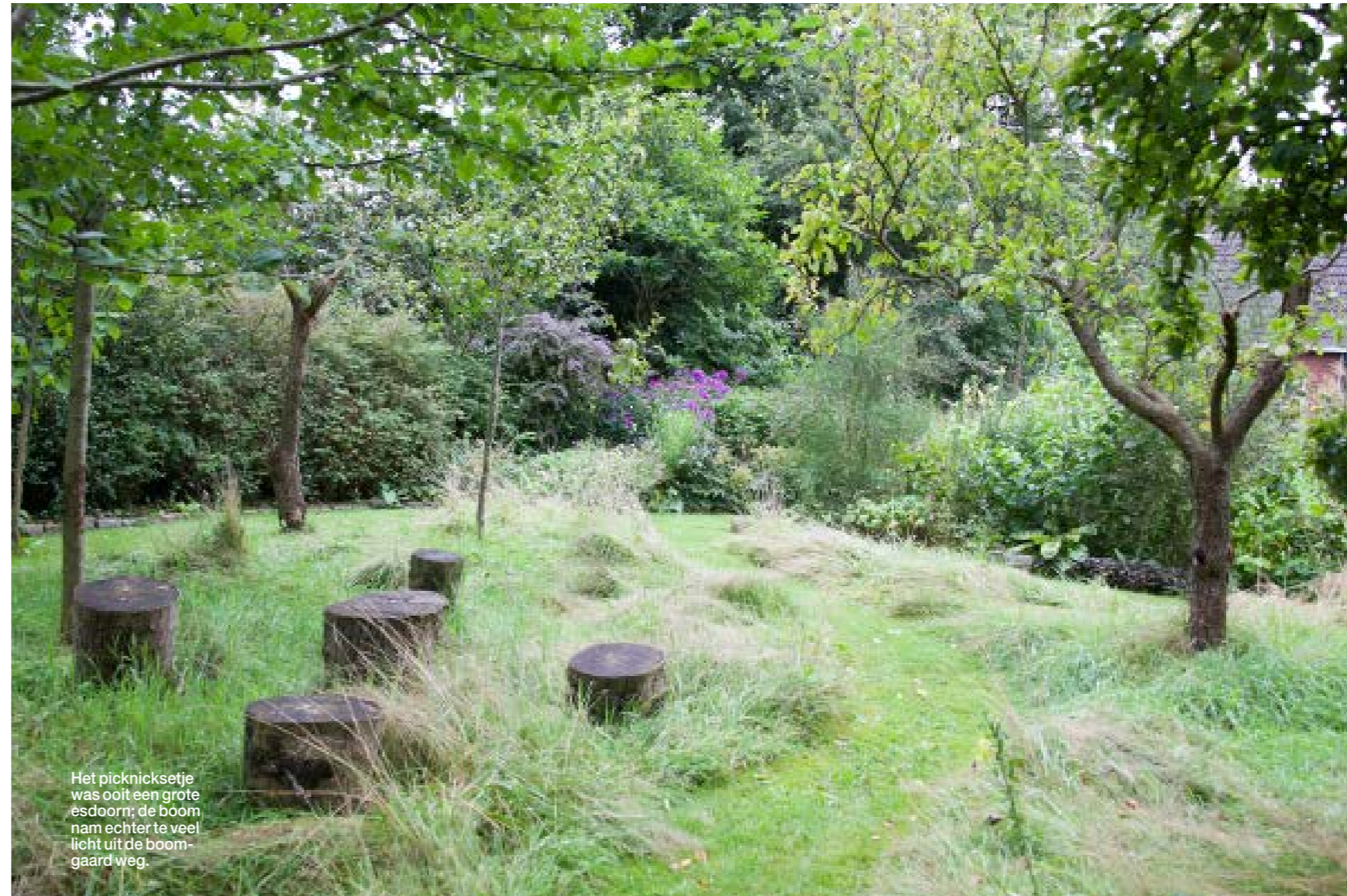
Het picknicksetje was ooit een grote esdoorn; de boom nam echter te veel licht uit de boomgaard weg.